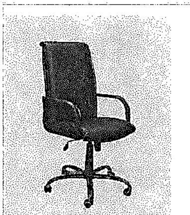
imagen a modo ilustrativo

Regulación neumática de altura del asiento. Base: Compuesta por 5 brazos de sección rectangular formando una estrella; base con alma de acero, envainada en plástico inyectado color negro. Ruedas de doble rodamiento. Plato de unión con el asiento elaborado en chapa de 3 mm.